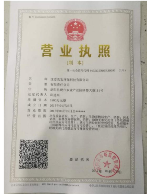
2017年4月25日，注册成立控股子公司江苏农宝环保科技有限公司。