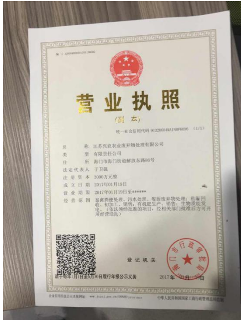
2017年1月19日，注册成立控股子公司江苏兴农农业废弃物处理有限公司。