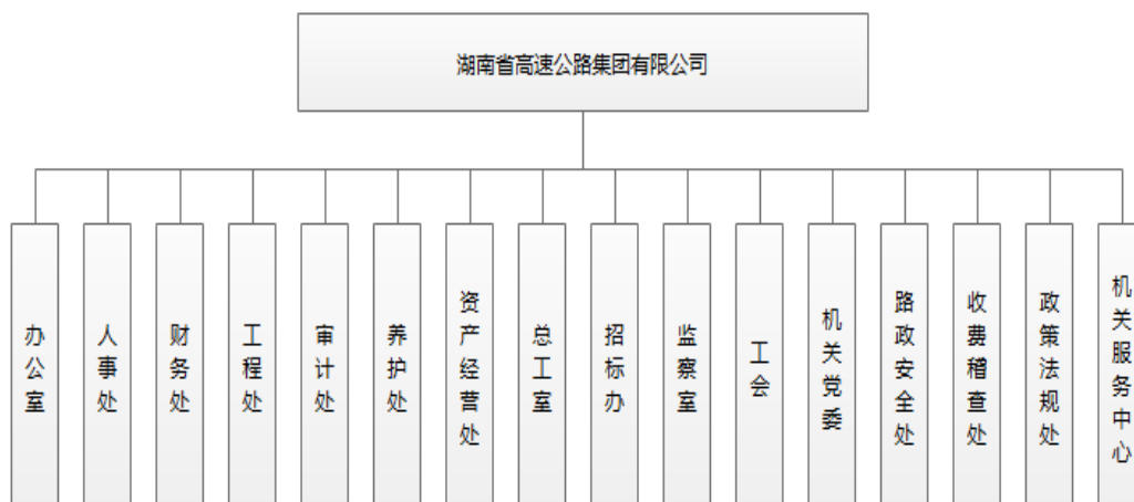
图：公司组织结构图