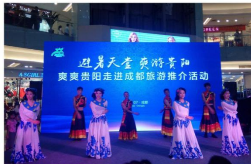
2016年7月《多彩贵州风》赴四川成都参加“爽爽贵阳走进成都旅游推介”活动。