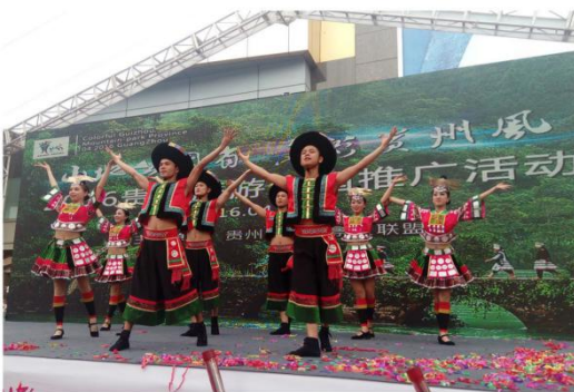
2016年4-7月《多彩贵州风》赴广东广州、广西南宁、云南各地、川渝等地参加“山地公园省·多彩贵州风”贵州精品景区旅游推荐会活动。