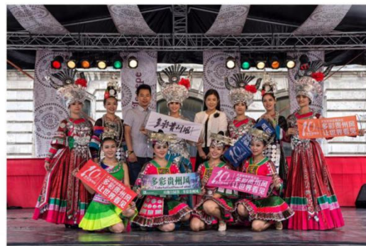
2016年8月《多彩贵州风》赴匈牙利首都布达佩斯参加多彩贵州东欧行-中国（贵州）匈牙利（布达佩斯）专场推介会