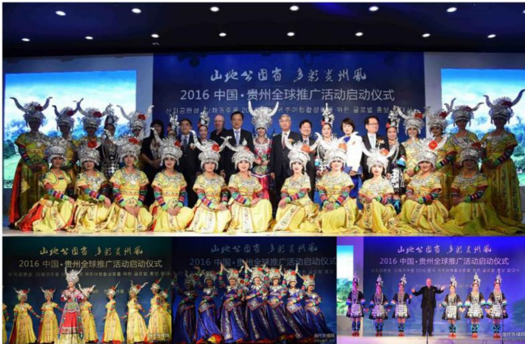
2016年4月《多彩贵州风》赴韩国首尔参加“山地公园省·多彩贵州风”全球推广活动启动仪式。

间手工业艺术节”演出，2016 年全年《多彩贵州风》小分队还先后赴广州、深圳、上海、杭州、四川、广西、湖南、重庆、黑龙江、内蒙、河北等主要城市巡回宣传演出。