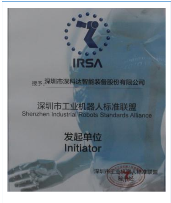
2015 年 2 月份，公司加入宝安区机器人产业联盟。