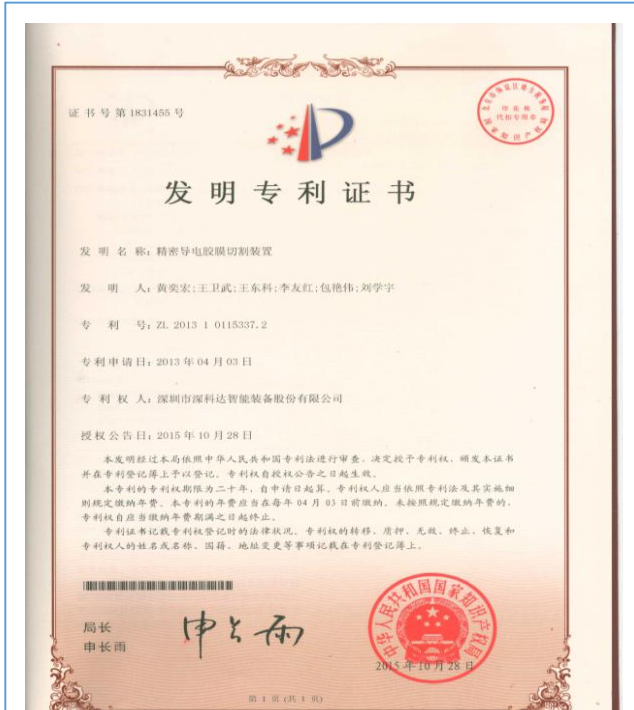
2015 年公司获得发明专利 2 项，实用新型专利 13 项，技术实力和创新能力显著。